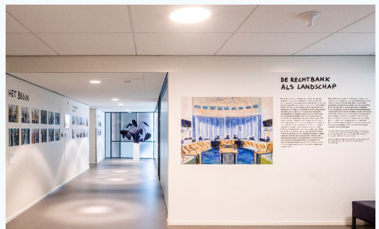
De rechtbank als landschap, tentoonstelling Rechtbank Rotterdam juli 2024.

De combinatie van kunst en wetenschap brengt ons nieuwe en mooie inzichten, niet alleen over terrorismezaken maar ook over de rol van de rechtbank in de samenleving. Door dit landschap in kaart te brengen, krijgen we een doorkijkje naar de manier waarop recht en samenleving verbonden zijn. Daarnaast kunnen we als wetenschappers op een laagdrempelige manier de rechtbank (visueel) uitleggen en begrijpen. “De rechtbank als landschap” is daarom een open uitnodiging aan de wetenschap en de kunst, om samen tot nieuwe inzichten te komen. Met een beetje oog voor menselijkheid, komen we immers al een heel eind.