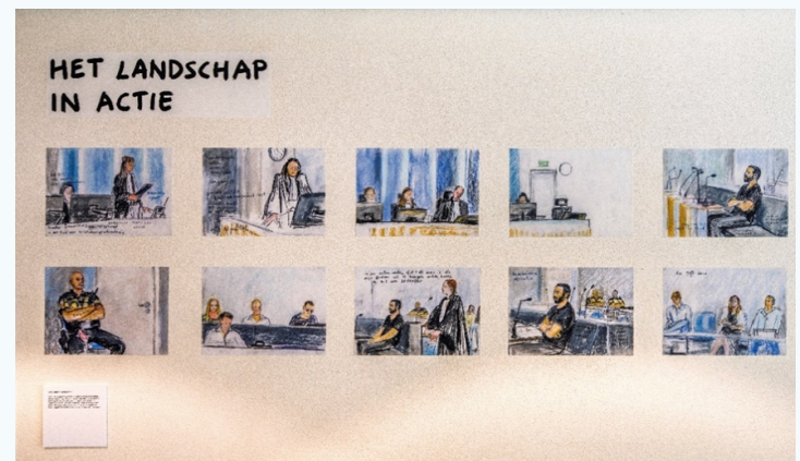
De rechtbank als landschap, tentoonstelling Rechtbank Rotterdam juli 2024.

zitting in kaart hebben gebracht. Deze zitting is bijzonder: de verdachte heeft geld overgemaakt naar vrouwen en kinderen in Syrische kampen. De rechtbank buigt zich over de vraag of deze transacties moeten worden begrepen als terrorismefinanciering of humanitaire hulp gezien de omstandigheden in de kampen. In de tekeningen zien we het recht in actie: de verdachte komt uitgebreid aan het woord en vertelt over zijn motieven. We horen ook van de families van uitreizigers, en hoe zij de zaak ervaren. Zo krijgen we middels deze zaak een inkijkje in hoe de verdachte een heel netwerk heeft opgezet om geld over te maken naar Syrië. Tevens horen we de verhalen van vrouwen en kinderen die vastzitten in de kampen na de val van de Islamitische Staat in 2019. Onze etnografie laat zien hoe deze zaak meer is dan alleen een veroordeling voor terrorismefinanciering: het brengt nuances aan in het politieke discours dat uitreizigers enkel een veiligheidsprobleem zijn, en maakt ruimte voor de emoties van betrokkenen en de verschillende verhalen die samenkomen tijdens de zittingen. De zaak is een puzzelstukje in een groter geheel van rechtszaken van mensen die zijn uitgereisd naar Syrië of Irak. In de collage proberen we het hele landschap op die manier te vangen: de specifieke vraag waar de rechters zich over buigen, en tegelijkertijd de grotere politieke en juridische context waarin de zaak moet worden begrepen.